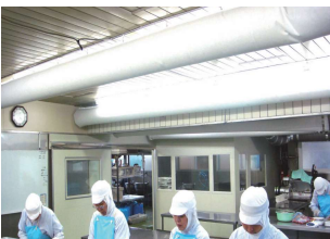
落下菌対策に効果を発揮!