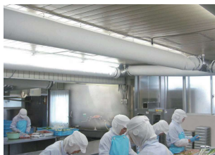
細菌やカビも捕捉・除去!

微風吹出しで食材の鮮度とムラのない作業者の快適を両立。 エレクト不織布フィルターで細菌やカビも捕集し瞬時にキャッチ。 素材が不織布で軽く着脱時の作業性も大変良く経済的です。