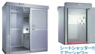
シートシャッター付 エアシャワー