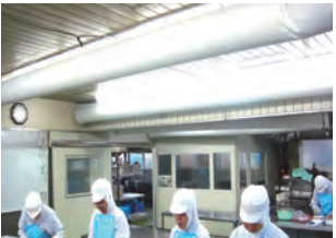
落下菌対策に効果を発揮!