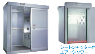
シートシャッター付 エアシャワー