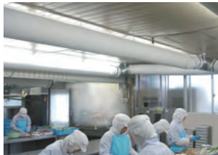
細菌やカビも捕捉・除去!

微風吹出しで食材の鮮度とムラのない作業者の快適を両立。 エレクト不織布フィルターで細菌やカビも捕集し瞬時にキャッチ。 素材が不織布で軽く着脱時の作業性も大変良く経済的です。